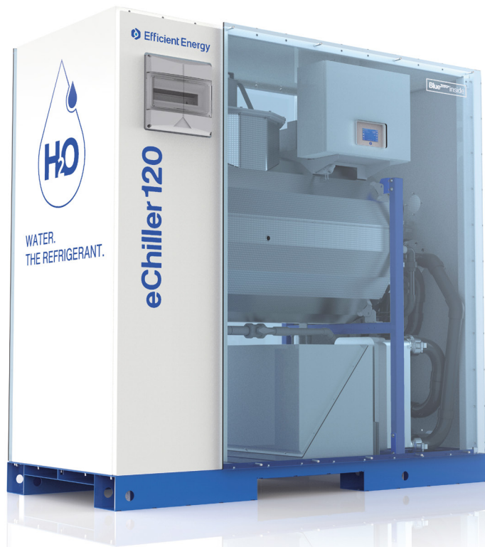
Darstellung inkl. aller Optionen